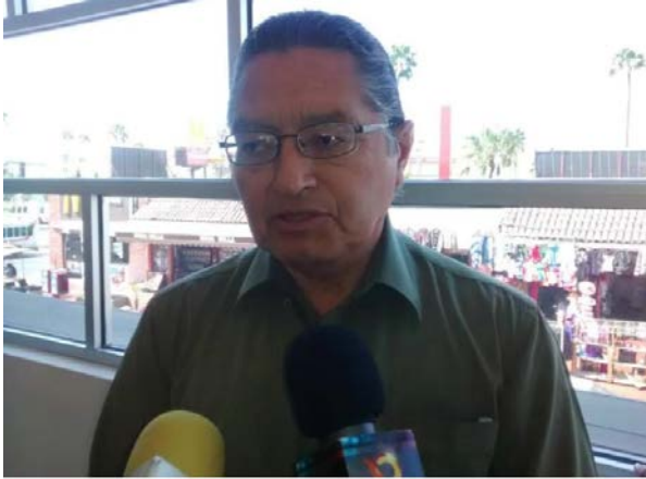
-Hay director interino en IMIP